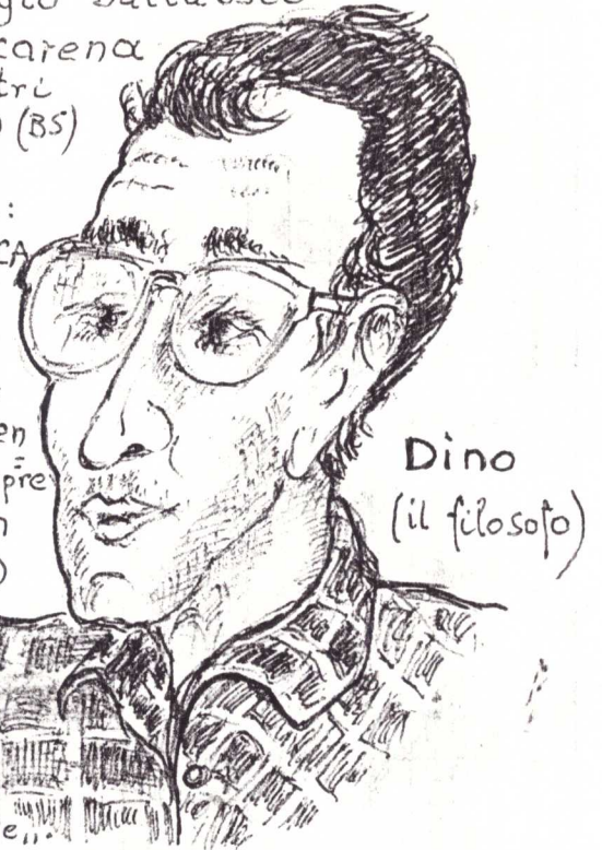
Dino (il filosofo)

Si discute di: CULTURA EBRAICA del XX° secolo e c'è un dia- logo fra il do- cente e i disce- nti (che non sempre si trovano in sintonia...)