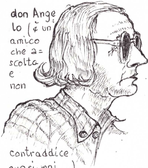
don Ange- lo (4 un amico che a- scolta e non